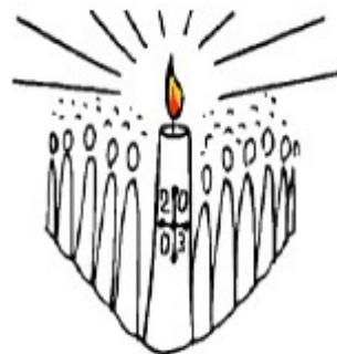
Dimanche de Pâques : la Résurrection