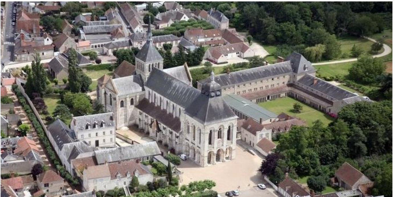
L'abbaye de Fleury à Saint Benoît sur Loire (monastère de bénédictins)