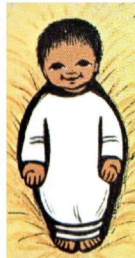
silhouette petit Jésus