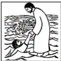
Ceux qui doutent