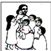
Les petits enfants